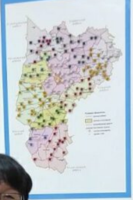
СХЕМА Административно-территориального деления Копыльского района