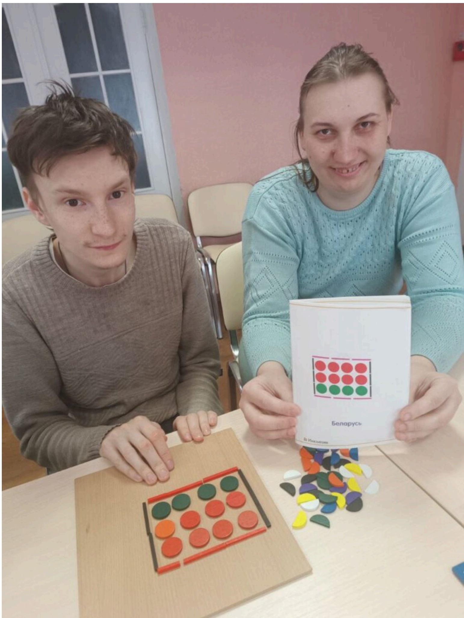
Трудовая мастерская «Радуга творчества» – изготовление сувениров на