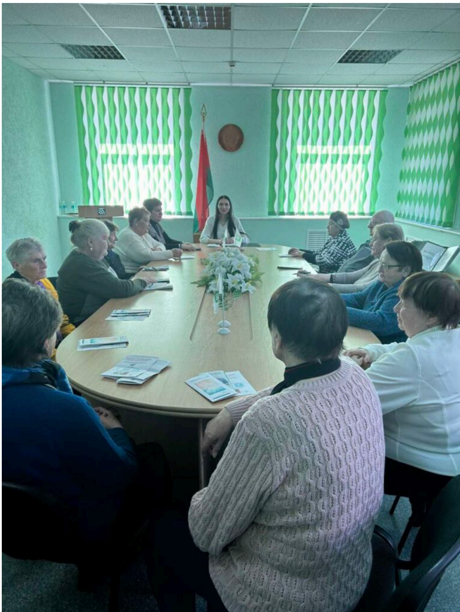
Для гостей проведена обширная экскурсия по всем отделам банка и