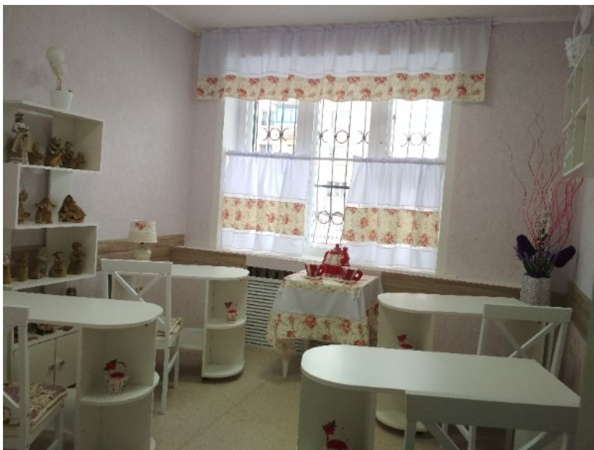
Мастерская народного творчества