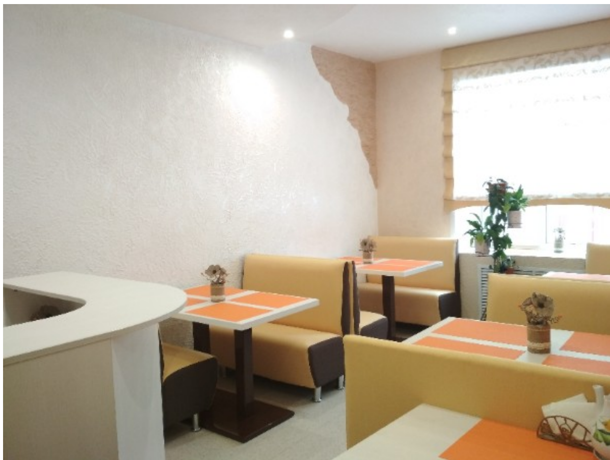
Комната приема пищи

В отделении создана домашняя атмосфера – оборудованы специальные помещения для проведения занятий, приема пищи, гигиены. Зона отдыха оборудована мягкой мебелью, имеется телевизор.